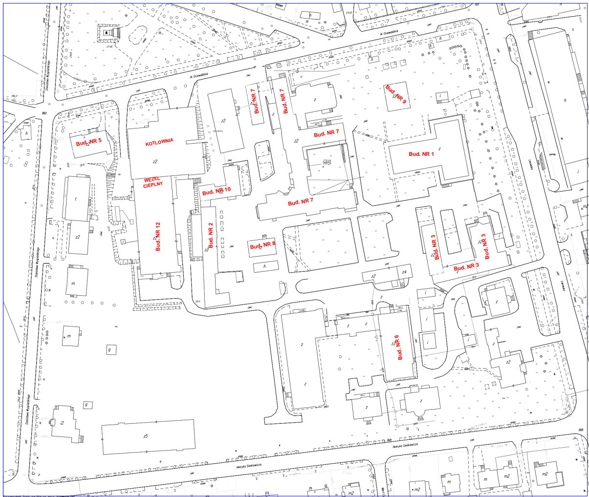
Mapka nr 1

W załączeniu mapki szpitala z opisanymi obiektami szpitalnymi i wskazaniem gdzie znajduje się kotłownia bądź węzeł ciepły